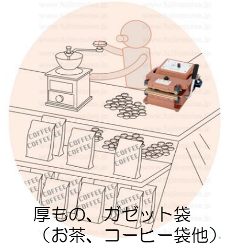
厚もの、カゼット袋 (お茶、コーヒー袋他)