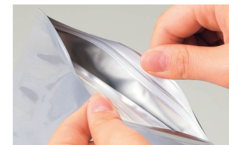
つまみやすいチャック上ベース加工