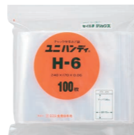
外袋セット写真(透明タイプ)