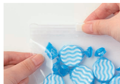
開け閉め、出し入れ簡単なスライダー装着