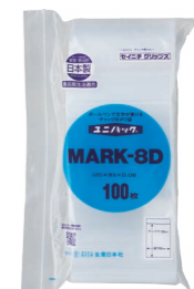
外袋セット写真 (0.08タイプ)