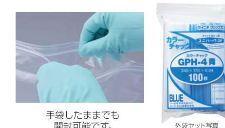
手袋したままでも開封可能です。