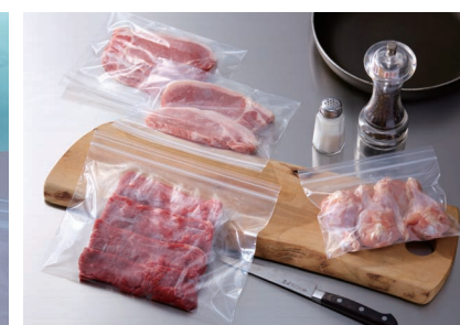
PSPトレーの代替としてもご使用頂けます。