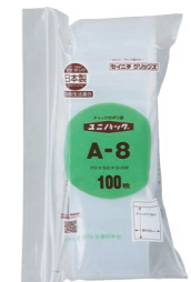
外袋セット写真 (0.08タイプ)