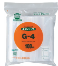
外袋セット写真 (0.04タイプ)