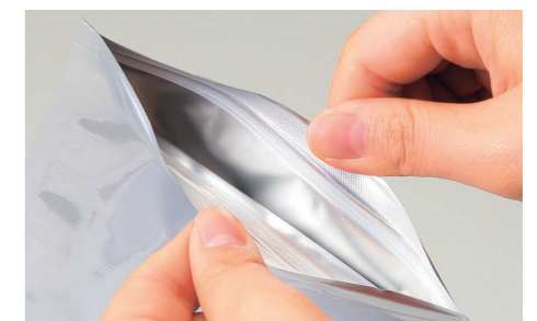
つまみやすいチャック上ベース加工