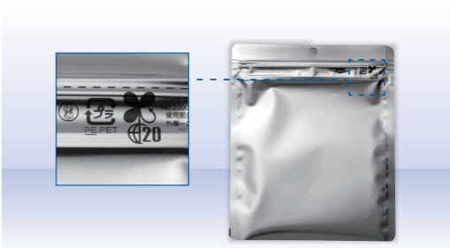
植物由来の原料を配合したPETフィルムを使用しています。