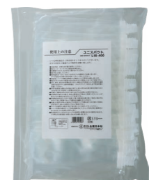
外袋セット写真 ※本体とキャップは分かれた状態で別々の袋に梱包しております。

サイドシール部分がなくて手に優しいワンハンドのパウチです。 従来品からダウンサイジングしたことでディスプレイ映えも期待できます。