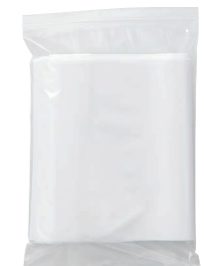
外袋セット写真(乳白タイプ)