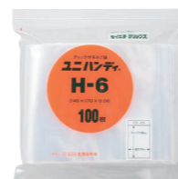
外袋セット写真(透明タイプ)