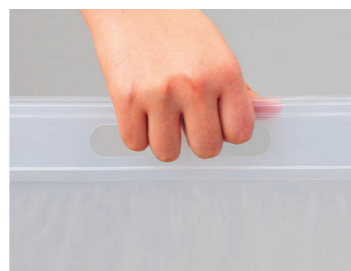
ユニハンディ®の持ち手部分は厚みがあり持ちやすい仕様です。