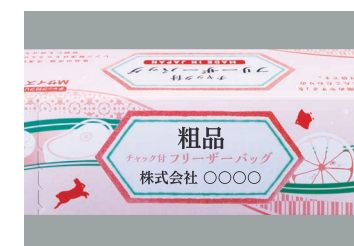
箱に社名・商品名等を名入れできます。