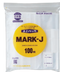
外袋セット写真 (0.04タイプ)