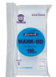
外袋セット写真 (0.08タイプ)