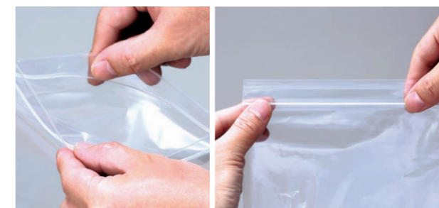
開けやすく、閉めやすいE-チャック®