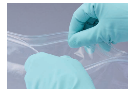
手袋したままでも開封可能です。