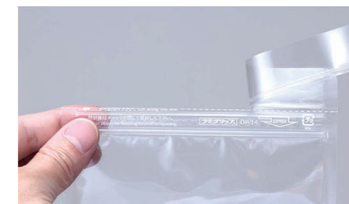
チャック上4本リブ加工は開封の際、直進性を高める加工です。