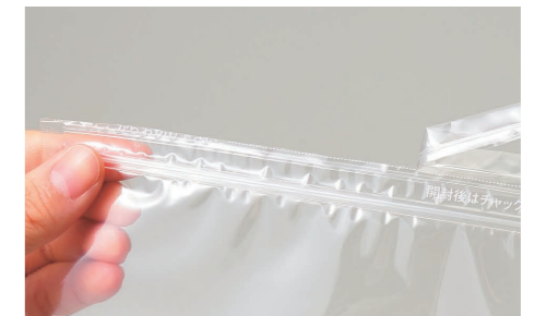
チャック上4本リブ加工は開封の際、直進性を高める加工です。