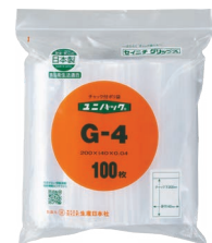
外袋セット写真 (0.04タイプ)