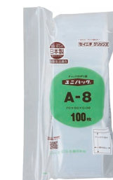
外袋セット写真 (0.08タイプ)