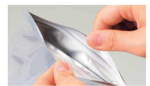
つまみやすいチャック上ベース加工