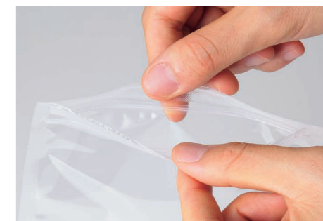
つまみやすい チャック上ベース加工

ウェービー®は内容物の重量を特殊形状のガゼット部分でバランスよく受け止め、自立性に優れています。