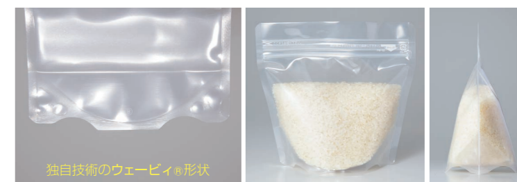
独自技術のウェービー®形状

ウェービー®は内容物の重量を特殊形状のガゼット部分でバランスよく受け止め、自立性に優れています。