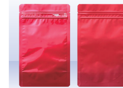
リバーシブルパウチ

*ご採用にあたりましては、当社製品のサンプルを用いて充填実用テストを行い、お客様にて十分なご評価をいただきますようお願い致します。製品の仕様は、諸般の事情により予告なく変更することがあります。あらかじめご了承ください。